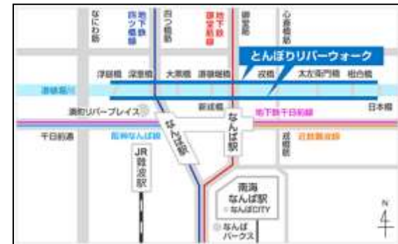
とんぼりリバーウォーク アクセス