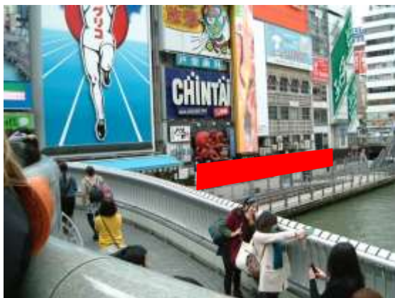
A 戒橋から道頓堀川を望む

大阪を代表する繁華街、道頓堀。「とんぼり」の愛称でも知られています。「グリコネオン」など大阪を代表する多くのネオン広告が、名所となっており、松竹座、国立文楽劇場などの大阪文化の発信、また「くいだおれ」「かに道楽」などの大阪のランドマーク的なエリアとなっています。また最近では海外からのインバウンド旅行客が多く、一度は訪れる観光名所となっています。その道頓堀の中心、「戒橋」では1日平均20万人(休日は35万人)の人が行き交い、外国人も年々多くなっています。その戒橋眼下の遊歩道に、この度、「とんぼりロングボード」を開発し、設置することになりました。