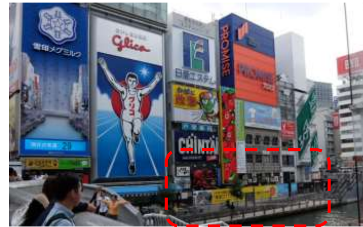
とんぼりロングボード設置状況