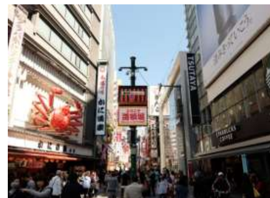
C 道頓堀商店街とかに道楽看板