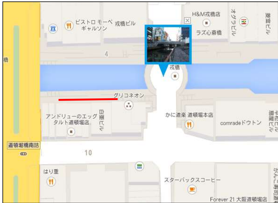
とんぼりロングボード ロケーション