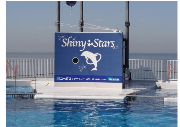
シャイニースタジアムステージバックパネル広告