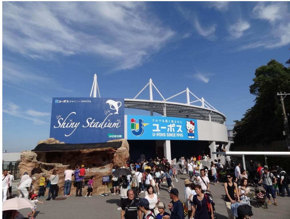
シャイニースタジアム壁面大型広告