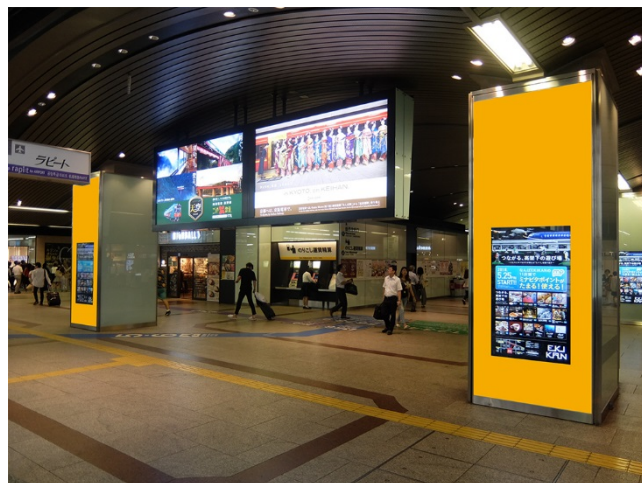
なんば駅3階北改札内