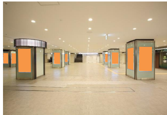
南海ADビジョン なんばB1高島屋前 ■放映時間:5:00~24:00 (19時間)