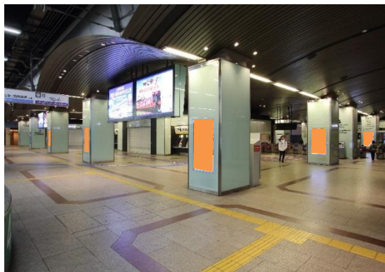
南海ADビジョン なんば3階北改札 ■放映時間:5:00~24:00 (19時間)

空港特急ラピートの起終点駅として、1日約25万人が利用する南海なんば駅。 そのメインとなる3階北改札口周辺にある「南海ADビジョン なんば3階北改札」。 そして、南海なんば駅・地下鉄各線・近鉄線・阪神線などの乗り換えのメイン導線上にある 「南海ADビジョン なんばB1高島屋前」が期間限定でセット(放映面数:43面)になりました。