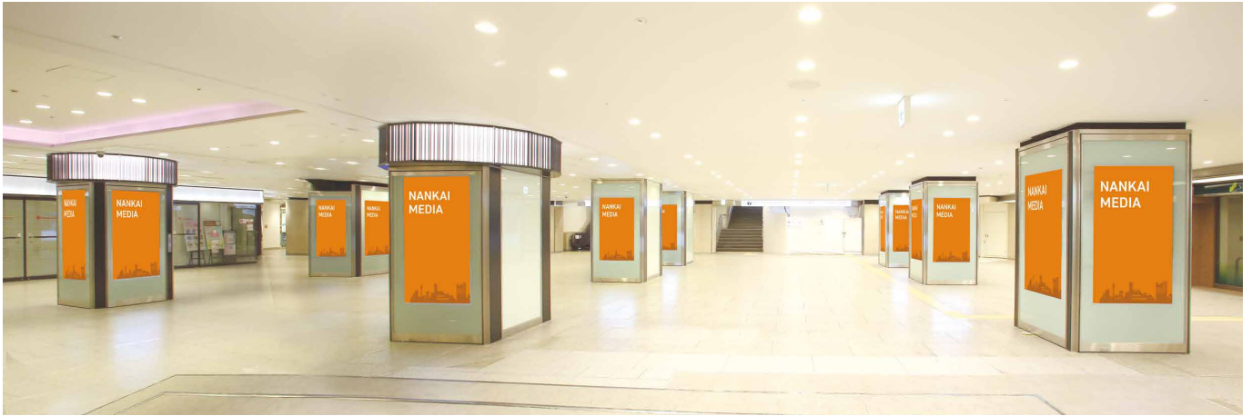
なんばB1高島屋前 大阪メトロ側

南海なんば駅から大阪メトロ各線・近鉄線・阪神線などの乗り換えのメイン動線上にある、70インチ・24画面のデジタルサイネージです。周辺には、なんばCITY・なんばパークス・高島屋大阪店などの大型商業施設があり、さまざまなお客さまへのアプローチが可能です。