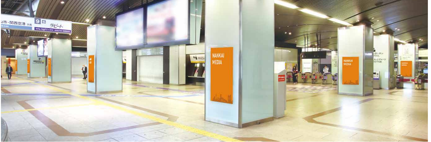
なんば3階北改札内

南海線・高野線の発着駅であり、1日約22万5千人が利用する南海なんば駅の3階北改札口周辺にある、70インチ・19画面のデジタルサイネージです。駅を利用されるお客さまへの効果的なアプローチが可能です。