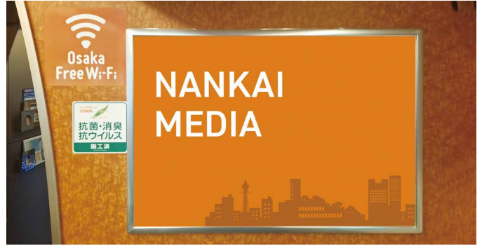
ラピート 特急額面A