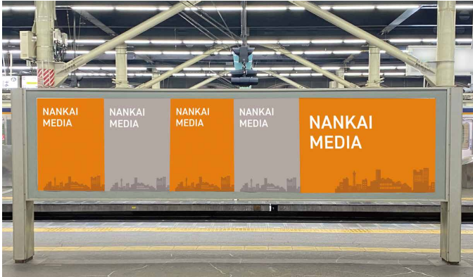
B0駅貼りポスター（横長サイズのみ：H1030mm×W1456mm） B1駅貼りポスター（縦長サイズのみ：H1030mm×W728mm）